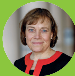
Annette Kurschus Ratsvorsitzende der Evangelischen Kirche in Deutschland

Die Schirmherrschaft über die Aktion haben: